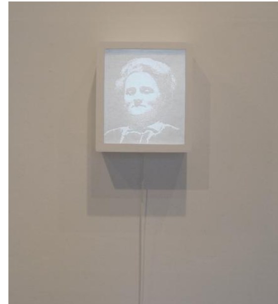
Élodie Wysocki, Portraits, série n°4, papier percés sur caisson lumineux, dim. variables, 6 modules, 2013.