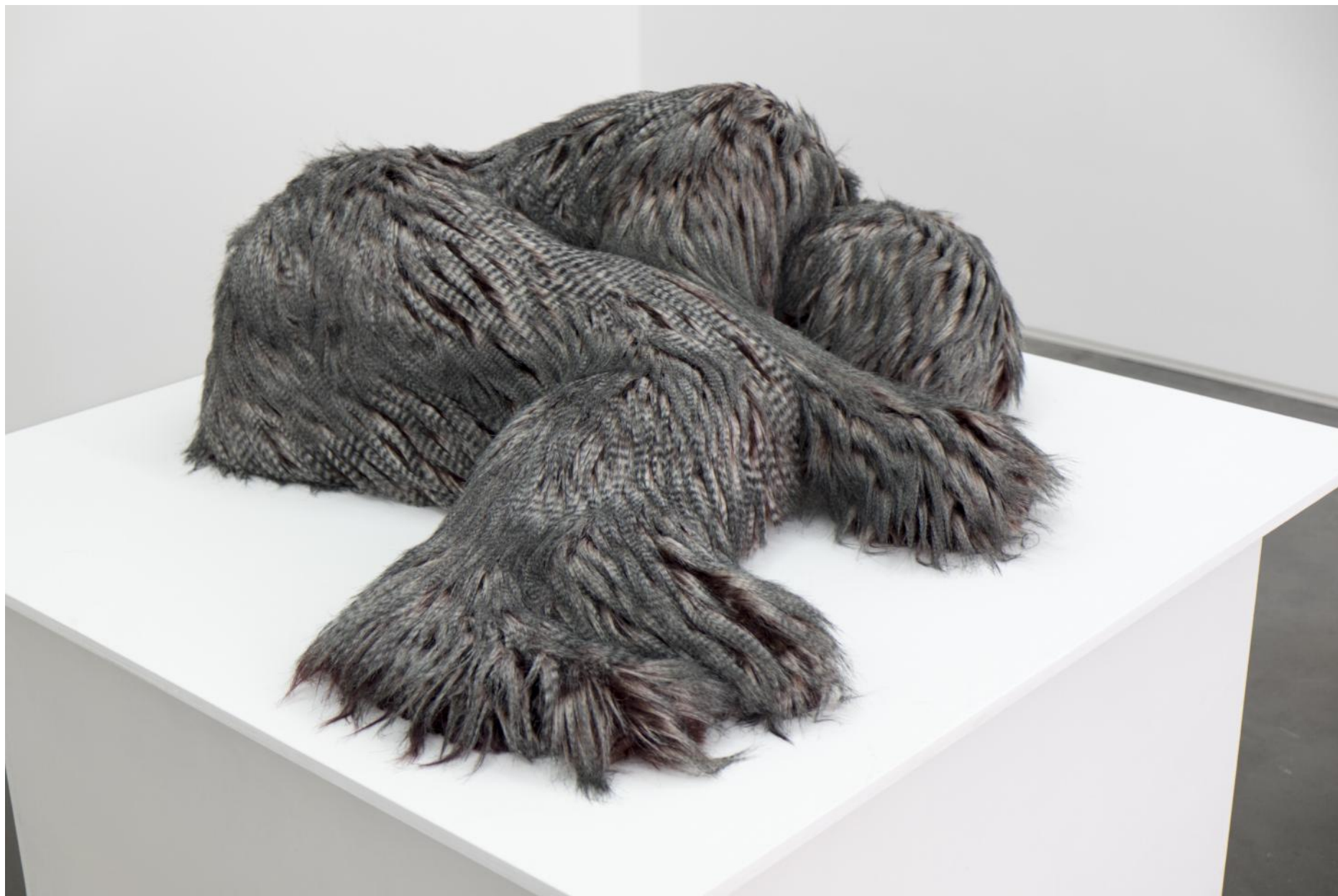
Élodie Wysocki, Série Les Darwinettes, résine et fausse fourrure, 100 x 90 x 35 cm, 2014.