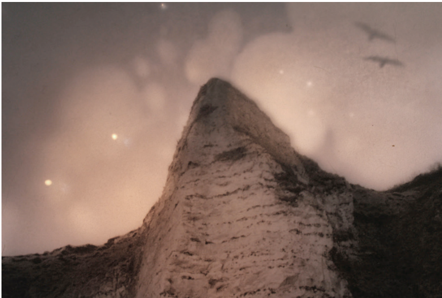
Falaise éclairée 2, Nocturama 2014, photographie, dimensions, 2014

Observant les liens entre image fixe et animée et les interstices créés entre temps et mouvement, elle s'attache à créer des images énigmatiques et hypnotiques, hors du temps, au plus proche de la sensation, jouant sur les concepts de présence/absence, de trouble de la perception et de la mémoire.