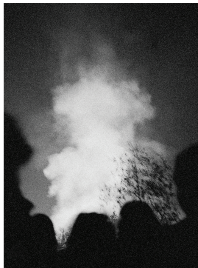
Exuvies, photographie, tirage lambda, 50 x 40 cm, 2013

"Fêlures", Galerie Les Bains Révélateurs, Roubaix "Exuvies", Carré Amelot, La Rochelle "The day empties its images", Nord Artistes, Roubaix "Rencontres du livre et de la photographie", Tourcoing