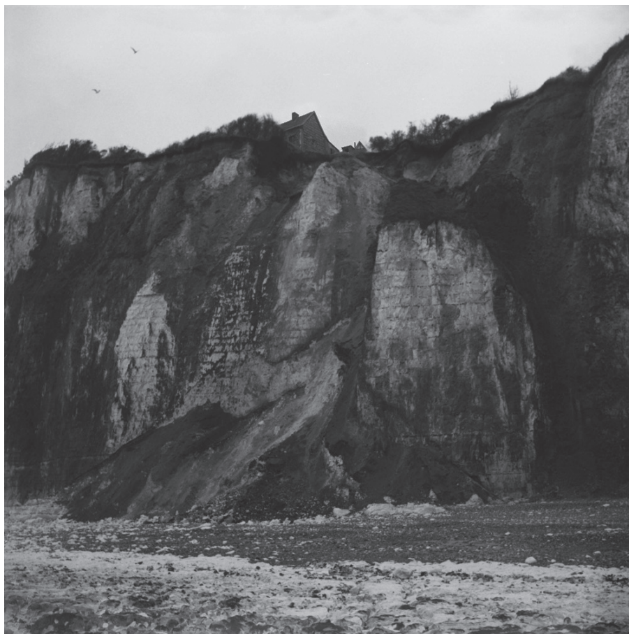
Falaise 1, Nocturama 2014, photographie 80 x 80 cm, 2014

“Rappelant les paysages côtiers chers aux impressionnistes, le paysage évolue progressivement avec la tombée du jour. Du jour à la nuit. Jouant de la lumière et de la transparence, ce projet réactive le principe du diorama, spectacle lumineux et fantasmagorique de sorte à créer une véritable «nature animée». A travers un dispositif simple, il fait apparaître une image invisible, au gré de la luminosité et semble réagir à la temporalité réelle. A travers ce travail réalisé spécialement pour l'espace de la galerie Anne Perré, je poursuis le but de provoquer des perceptions visuelles. Il combine mes différents centres d'intérêt que sont la photographie, la contemplation du paysage et l'observation des évolutions des états lumineux. Le processus lent et les paysages naturels présentés, invitent à une sorte d'état introspectif et contemplatif en décalage avec le spectaculaire actuel. Mon travail tente de provoquer un rapport quasi romantique et intimiste entre le spectateur et le paysage duquel émerge silence et solitude .