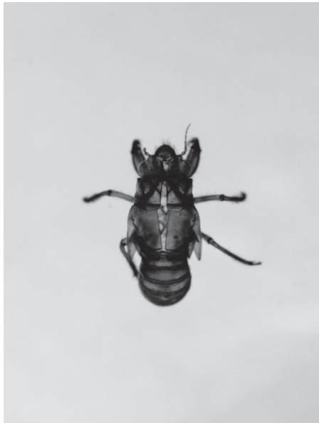
Exuvies 1 , photographie, tirage lambda, 50 x 40 cm, 2013